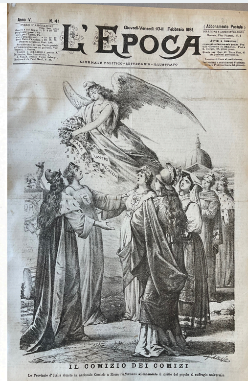
IL COMIZIO DEI COMIZI

L. Tobb, A la souveraineté nationale, in L.-A. Garnier-Pagès, Histoire de la Révolution de 1848, édition illustrée, vol. 1, Degorce-Cadot, Paris, 1868-1870, p. 41.